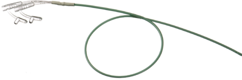
DLC-6D 6Fr. Dual Lumen Cystometry Catheter

Quality Management System: 13485:2007 Notify Body: BSI Certificate Number: N/A Effective Date: N/A