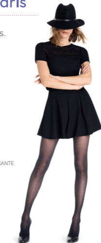
*avec la gamme ESSENTIEL SEMI-TRANSPARENT

Trouvez le produit qui vous correspond parmi les Essentiel, Styles ou Active.