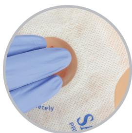
Réduit le temps de compression active