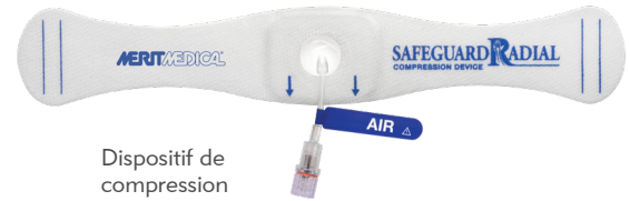
Dispositif de compression radiale