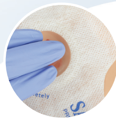
Réduit le temps de compression active 1