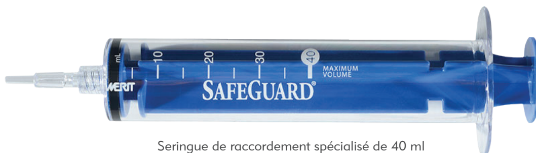
Seringue de raccordement spécialisé de 40 ml