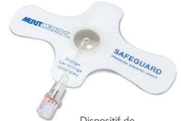
Dispositif de pression assistée 12 cm