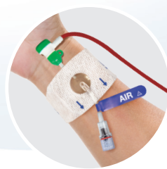
Hémostase fémorale et radiale