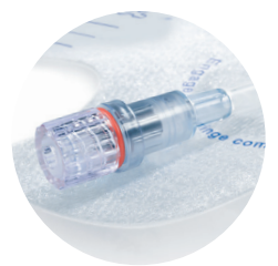
Raccordement spécialisé pratique et sécurisé